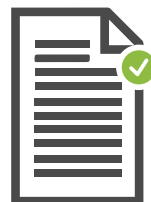
Recibo de Pago