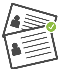
Copia del DNI

Los participantes de la asesoría de tesis tendrán que presentar y enviar los siguientes documentos: